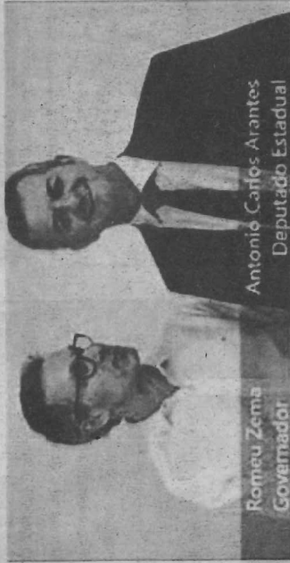
Romeu Zema Governador

Arantes foi prefeito de Jacuí e um dos principais assessores da Prefeitura de São Sebastião do Paraíso na gestão de Marilda Melles – sendo um dos principais integrantes do grupo do ex-deputado Carlos Melles – atual presidente nacional do Sebrae.